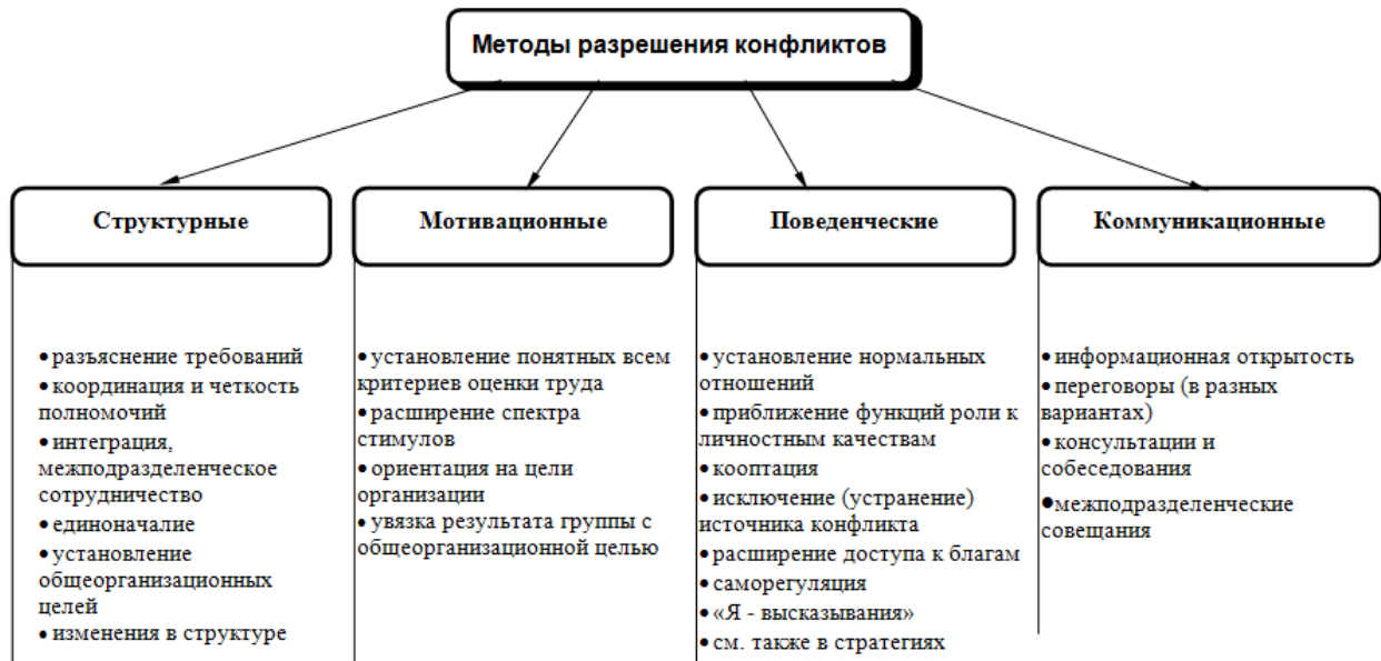
Рис. 1. Методы разрешения конфликтов