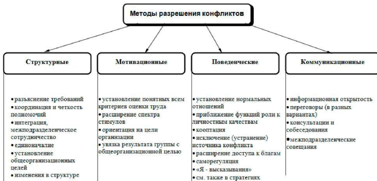
Рис. 1. Методы разрешения конфликтов