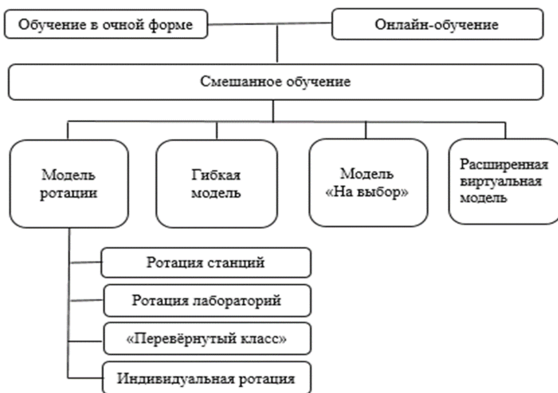
Рисунок 1. Модели смешанного обучения

Как показывает изучение отечественного и зарубежного опыта применения смешанного обучения, одной из моделей, которая широко используется школьными учителями в своей практике, является модель ротации [30, 1, 3, 36].